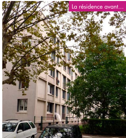
La résidence avant...