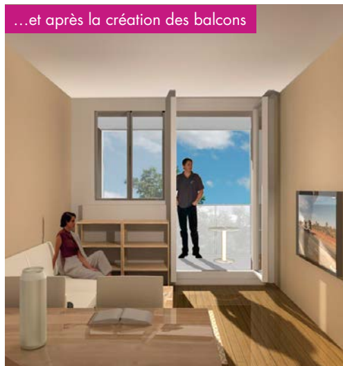
...et après la création des balcons