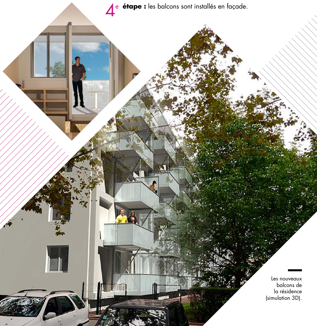
Les nouveaux balcons de la résidence (simulation 3D).