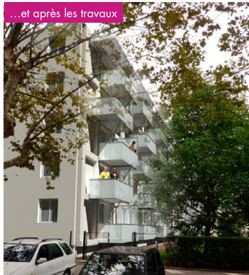
...et après les travaux