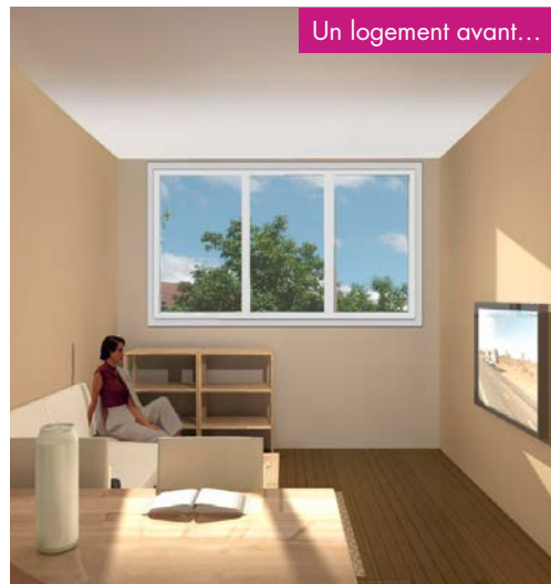
Un logement avant...