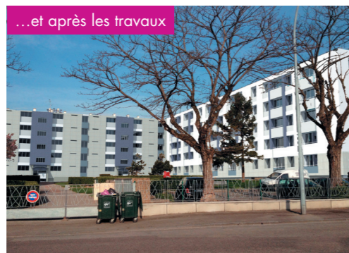
...et après les travaux