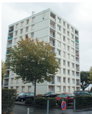
66 rue Legay : avant...