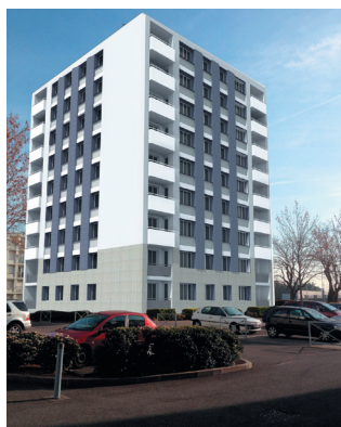
et après les travaux

Objectif : diviser par 2 la facture de chauffage