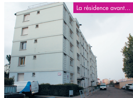
La résidence avant...

Vous continuez à habiter chez vous durant les travaux. Les entreprises mettent tout en œuvre pour limiter les perturbations de votre quotidien.