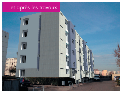
...et après les travaux