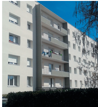
La façade du bâtiment 2, déjà terminée

La rénovation des façades est achevée sur les bâtiments 1 et 2. Ces nouvelles façades isolées par l'extérieur vont permettre une meilleure performance énergétique des logements en limitant les déperditions énergétiques. Elles permettent également de réduire les phénomènes de condensation en hiver.