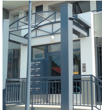
L'auvent et les nouveaux gardes corps des coursives du rez-de-chaussée du bâtiment 1

Il était impossible de généraliser comme de conserver des coursives fermées au rez-de-chaussée, pour des raisons de sécurité incendie. Les vitres des coursives du rez-de-chaussée sont donc retirées et remplacées par une grille en